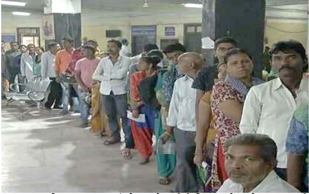
અમદાવાદ સહિત ગુજરાતભરમાં રોગચાળો ફાટીની નિકળ્યા છે ત્યારે અમદાવાદની સિવિલ હોસ્પિટલમાં દર્દીઓને સવાર પડેને લાઈનો લાગી જાય છે અમદાવાદ શહેરમાં ઘેર ઘેર બિમારીના ખાટલા છે. ત્યારે દર્દીઓ દવા લેવા હોસ્પિટલમાં ઉમટી પડે છે.