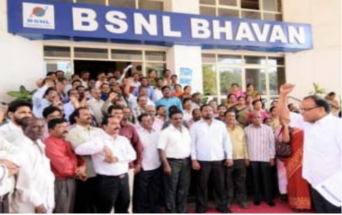
નિવૃત્ત થતાં પહેલાં સીજેઆઈ રંજન ગોગોઈની બેંચે જ આ ચુકાદો આપશે આજે સુપ્રિમ કોર્ટ સબરીમાલા, રાહુલ ગાંધી અને રાફેલ અંગે ચુકાદો આપશે

નવીદિલ્હી, નાણાંકીય સંકટમાં ફસાયેલી સરકારી ટેલિકોમ કંપની ભારત સંચાર નિગમ લિમિટેડ (બીએસએનએલ)એ આશા વ્યક્ત કરી છે કે કંપનીના લગભગ ૮૦,૦૦૦ કર્મચારી વીઆરએસ (સ્વેચ્છિક સેવાનિવૃત્તિ) યોજનાની પસંદગી કરી શકે છે તેનાથી કંપનીને પગારમાંથી દર મહીને ૬૦૦ કરોડ રૂપિયાની વચત થશે બીએસએનએલને આશા છે કે જો આમ થશે તો તેને દર વર્ષે ૭,૦૦૦ કરોડ રૂપિયાની બચત થશે અને આ રીતે તે પાંચ વર્ષની અંદર લાભમાં આવી જશે બીએસએનએલના ૮૦,૦૦૦ કર્મચારી વીઆરએસ સ્કીમની પસંદગી કરી શકે છે પરંતુ આ સંખ્યા પાર કરી ચુકી છે. બીએસએનએલ દેશની સૌથી મોટી લોસ મેકિંગ સરકારી કંપની છે અને આશા વ્યક્ત કરવામાં આવી રહી છે કે નાણાંકીય વર્ષ ૨૦૧૯-૨૦માં