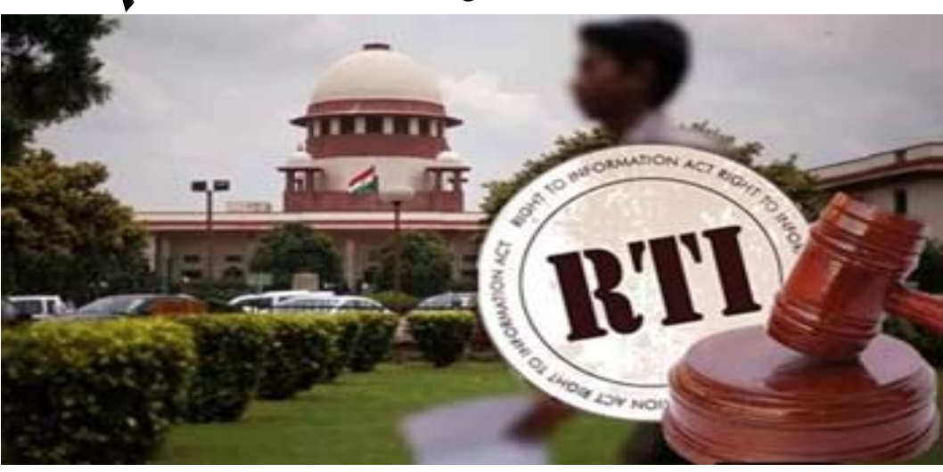
ઓથોરીટી" છે અને તેને આરટીઆઈના કાયદો લાગુ પડી શકે છે. સુપ્રિમ કોર્ટની બેંચે ચાલુ વર્ષના એપ્રિલમાં પોતાનો આ ચુકાદો અનામત રાખ્યો હતો. જે આજે સીજેઆઈ જસ્ટિસ ગોગોઈના ૧૭ નવેમ્બરના રોજ નિવૃત્તિના ૪ દિવસ પહેલાં જાહેર કરવામાં આવ્યો છે. આ અગાઉ સીજેઆઈએ એમ કહ્યું હતું કે પારદર્શકતાના નામે કોઈ એક સંસ્થાને નુકશાન થવું જોઈએ નહીં. નવે.૨૦૦૭માં એક આરટીઆઈ કમ્પેનિયન અરજીને અગ્રવાલે આરટીઆઈ કરીને સુપ્રિમ કોર્ટના જજોની સંપત્તિની અને જસ્ટિસ એચ.એલ. દત્ત, જસ્ટિસ

ન્યુ દિલ્હી, ભારતના ન્યાયતંત્રમાં પારદર્શકતાને મહત્વ આપતાં અને દૂરોગામી વમળો પેદા કરનાર એક ચુકાદામાં, સુપ્રિમ કોર્ટના નિવૃત્ત થઈ રહેલાં ચીફ જસ્ટિસ રંજન ગોગોઈની અધ્યક્ષતાની બેંચે ઠરાવ્યું કે સુપ્રિમ કોર્ટના મુખ્ય ન્યાયમૂર્તિ(સીજેઆઈ)નું કાર્યાલય એક જાહેર કાર્યાલય છે અને તેથી તેને માહિતીના અધિકારનો કાયદો લાગુ પડે છે અને કાયદાના દાયરામાં લાવવું જોઈએ. આ ચુકાદાના પગલે હવે કોઈપણ નાગરિક માહિતીના અધિકાર-આરટીઆઈ કરીને સીજેઆઈની અને અન્ય જજોની માહિતી માંગી શકશે. જો કે કોર્ટે એવું પણ નાંધ્યું છે કે આ કાયદાની જોગવાઈઓનો